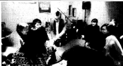
マジシャンを招いて行われたイベントの様子

本格的な音楽スタジオを備えた飲食店「OPAGE STUDIO(ゼロページスタジオ)」がこのほどオープンした。楽器の演奏や音楽鑑賞、カラオケ